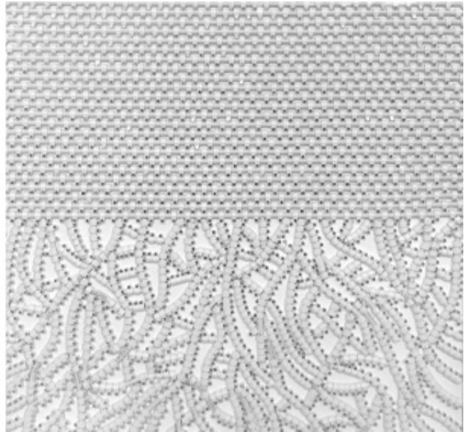
2019, coaxial antenna cable and staples, 55 x 62 cm.

La première chose qu'on peut dire de la sculpture racines de mounir fatmi : c'est qu'elle est complexe. Complexe par la technique que l'artiste utilise depuis 1998 qui consiste à faire des bas reliefs avec des câbles blancs d'antennes. Ce matériau utilisé depuis la création de la télévision pour relier une antenne à un téléviseur et diffuser des images, constitue la base première de l'œuvre.