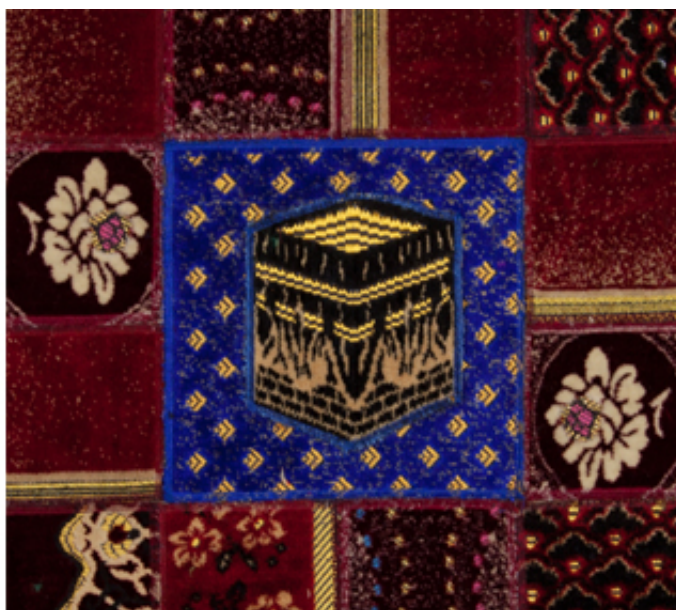
2014-2015, collages of prayer rugs on canvas, 80 x 80 cm. Courtesy of the artist.