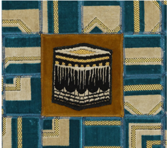
2018, collages of prayer rugs on canvas, 200 x 200 cm.