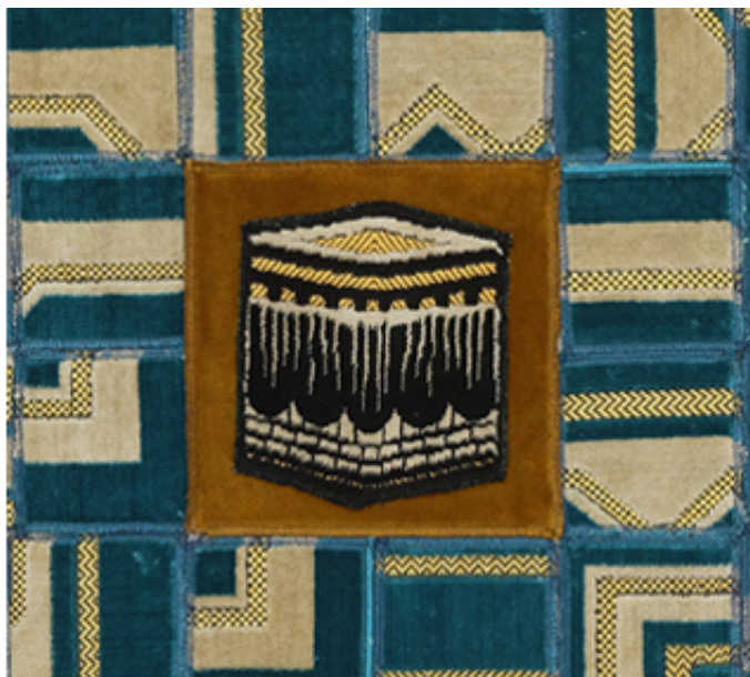
2018, collages of prayer rugs on canvas, 200 x 200 cm.