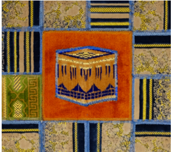
2016, collages of prayer rugs on canvas, 80 x 80 cm.