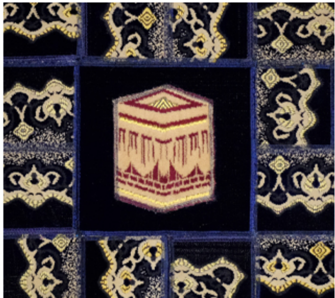
2016, collages of prayer rugs on canvas, 80 x 80 cm.