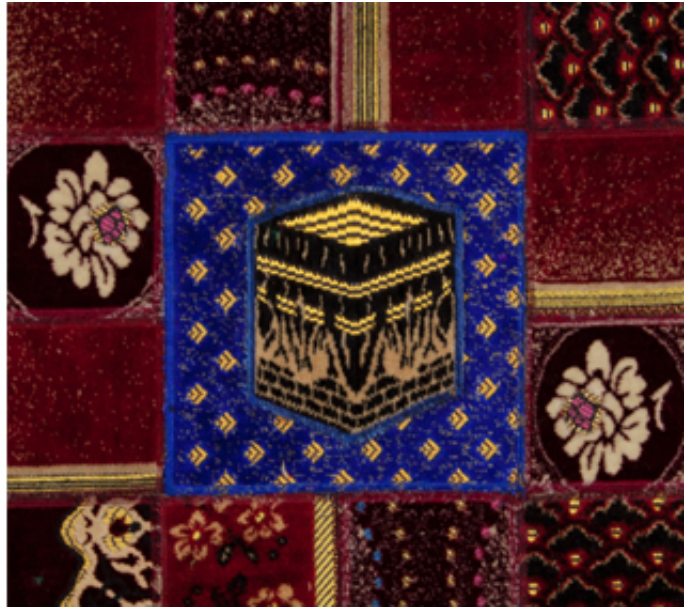
2014-2015, collages of prayer rugs on canvas, 80 x 80 cm.