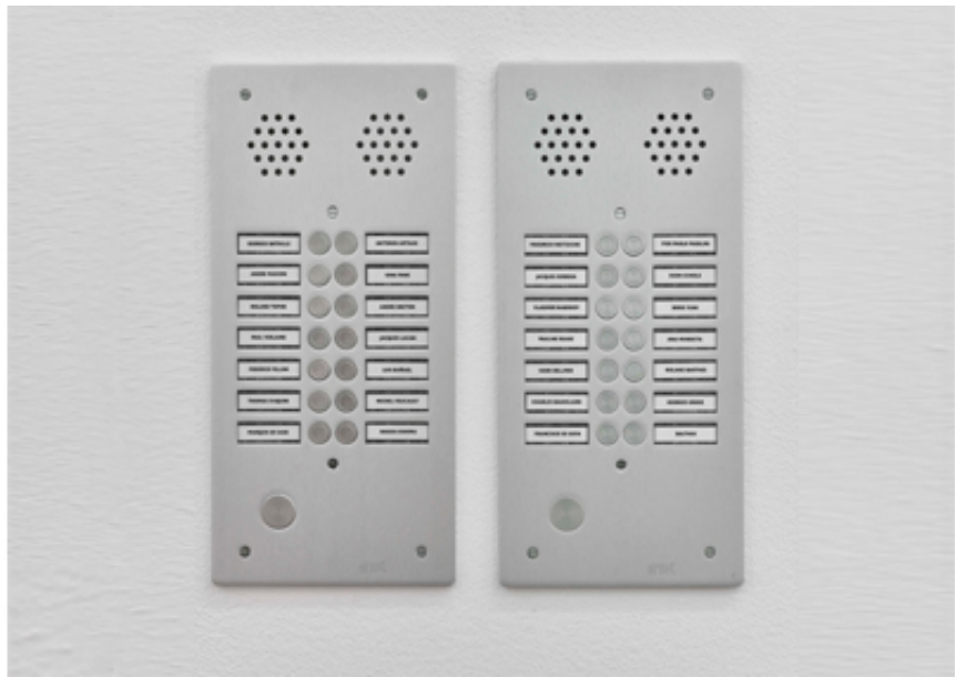
2014-2016, diptych, 38,5 x 18 cm each, doorbells in metal. Exhibition view from Depth of Field, Labanque, 2016, Béthune.