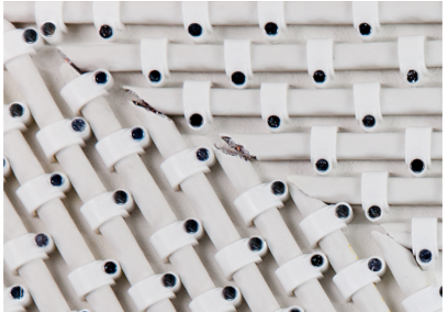
2013, 35 x 37 cm, coaxial antenna cable, staples, plexiglass.

Qui a besoin d'un Dieu Triangle? joue avec les perceptions à la manière d'une illusion d'optique. La sculpture blanche se confond avec les murs blancs et disparaît progressivement dans le décor. Son aspect plat et uniforme est une illusion également et la surface irrégulière est en réalité composée de sections de câbles coaxiaux à gaine blanche - matériau utilisé jusqu'à la fin du 20e siècle pour relier une antenne à un téléviseur et transmettre des images - rassemblés selon différents angles, puis épinglés sur un panneau blanc de telle sorte qu'ils laissent apparaître une surface triangulaire non recouverte au centre de la composition.