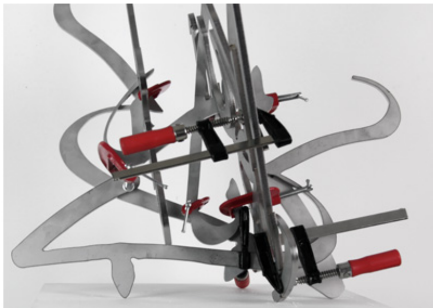
2012-2016, steel, clamps, 56 x 46 x 52 cm, pedestal: h107 x 45 x 45 cm. Exhibition view from Art Cologne, Conrads Gallery, 2016, Cologne. Courtesy of the artist and Ceysson & Bénétière, Paris.

Calligraphie de feu est une série sculpturale montrant des phrases déconstruites. Des calligraphies arabes découpées dans des plaques de métal tenues par des pinces et prises en étau, prennent la forme de flammes. Cette série se développe en deux formes distinctes. La première, plus ramassée, rappelle nettement la forme d'une seule flamme. La seconde, plus développée, évoque la structure d'une phrase comme une flambée suivant son propre cheminement.