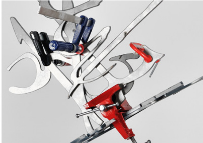
2012, steel, clamps, 42 x 48 x 48 cm, pedestal: h107 x 38 x 38 cm. Exhibition view from Edge of Silence, Goodman Gallery, 2015, Cape Town.

Calligraphie de feu est une série sculpturale montrant des phrases déconstruites. Des calligraphies arabes découpées dans des plaques de métal tenues par des pinces et prises en étau, prennent la forme de flammes. Cette série se développe en deux formes distinctes. La première, plus ramassée, rappelle nettement la forme d'une seule flamme. La seconde, plus développée, évoque la structure d'une phrase comme une flambée suivant son propre cheminement.