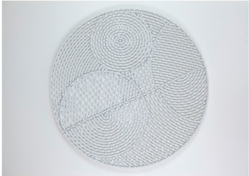
2011, coaxial antenna cable, staples on plywood, 69 cm.

Les Cercles, avec leur aspect blanc immaculé et épuré, leur jeu d'associations des formes, de tensions entre lignes droites et courbes, de révélation et d'occultation des figures, attirent le regard autant qu'ils soulèvent de questions. La série des Cercles est réalisée au moyen de câbles d'antennes blancs - matériau récurrent des œuvres de Mounir Fatmi depuis 1998, disposés en motifs géométriques, puis fixés à des panneaux blancs et circulaires à l'aide d'attaches à tête rondes. Les compositions obtenues sont parfois surmontées d'un second panneau circulaire blanc en plexiglas, découpé à certains endroits, et laissant apparaître les câbles coaxiaux.