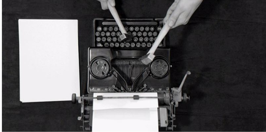
Mounir Fatmi.