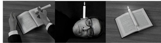
Mounir Fatmi.

Mounir Fatmi was born in 1970 in Tangier, Morocco and lives and works between Paris and Tangier. Since leaving Morocco in 1999, he is particularly interested in issues of exile, and the role of the artist in a society in crisis. Fatmi views himself as an immigrant worker: "My job is to question what it means to be an artist. Even when I feel outside of my own cultural context." He has participated in the 52nd and the 57th Venice Biennale, the 7th Dakar Biennial, the 2nd Sevilla Biennial, the 5th Gwangju Biennial, the 10th Lyon Biennial, and the 5th Auckland Triennial. Recent solo exhibitions include "Spot On: Mounir Fatmi," Museum Kunst Palast, Düsseldorf, Germany, "Permanent Exiles," MAMCO, Geneva, Switzerland, "Darkening Process," The MMPV Museum, Marrakech, Morocco.