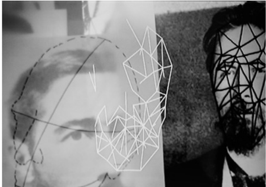
2013, France, 11 min, HD, B&W, stereo. Courtesy of the artist and Jane Lombard Gallery, New York. Ed. of 5 + 2 A.P.

Quand Salman Rushdie est entré dans la clandestinité suite à sa fatwa, il a été forcé de vivre une autre vie, et il a souvent utilisé le pseudonyme de Joseph Anton, un nom inspiré par deux de ses auteurs favoris, Joseph Conrad et Anton Chekov.