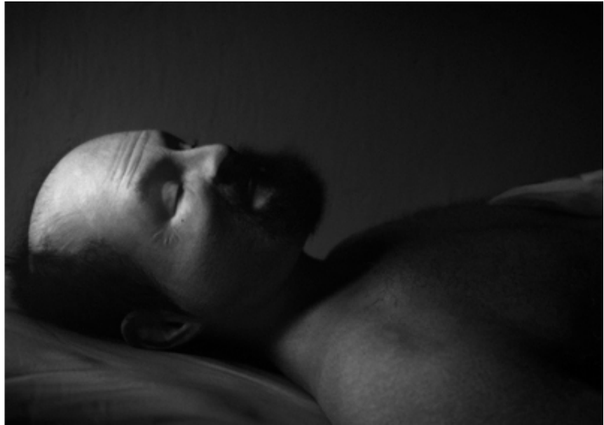
2005-2012, France, HD, B&W, stereo. Version of 26 minutes and 10 minutes. Courtesy of the artist and Jane Lombard Gallery, New York. Ed. of 5 + 2 A.P.