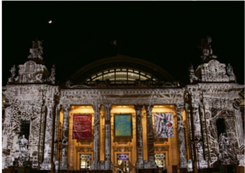
2010-2012, France, video installation, 15 min, HD, N&B, stéréo. Exhibition view from Art Paris, Grand Palais, 2015, Paris. Ed. of 5 + 2 A.P.

« Les Temps modernes » est une vidéo qui donne à voir une vaste et complexe composition géométrique blanche sur fond noir et met en mouvement de nombreux motifs aux formes variées, parmi un entrecroisement de lignes. Une bande sonore constituée de bruits de moteurs en marche rythme l'évolution de cette composition graphique sans cesse changeante. La vidéo a été projetée dans plusieurs expositions artistiques et aussi sur les façades d'édifices architecturaux.