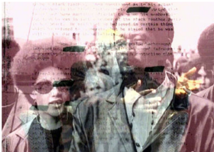
2006, France, 37 min 24, SD, 4/3, color, stereo. Grand prix Léopold Sédar Senghor -Dak'art, 7ème biennale de Dakar, Dakar, 2006. Ed. of 5 + 2 A.P.

This work was part of 11 Bienal de Arte de Lanzarote - Como la liebre en el páramo, Lanzarote, 2022.