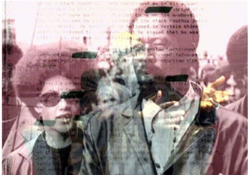
2006, France, 37 min 24, SD, 4/3, color, stereo. Grand prix Léopold Sédar Senghor -Dak'art, 7ème biennale de Dakar, Dakar. 2006. Ed. of 5 + 2 A.P.

Le projet du film « Histoire de l'histoire » est né en 2006, lorsque l'artiste découvre que les documents d'archives du FBI concernant le Black Panthers Party sont désormais accessibles. Alors que le BPP et ses membres historiques restent en France politiquement mal perçus, mounir fatmi imagine un projet autour de l'histoire de ce mouvement révolutionnaire né en 1966 au lendemain de l'assassinat du leader du Black Power, Malcolm X. L'artiste invite donc David Hilliard, ancien membre fondateur et chef de l'état-major du Black Panthers Party, proche du leader Huey P. Newton, afin de s'entretenir longuement avec lui à Paris.