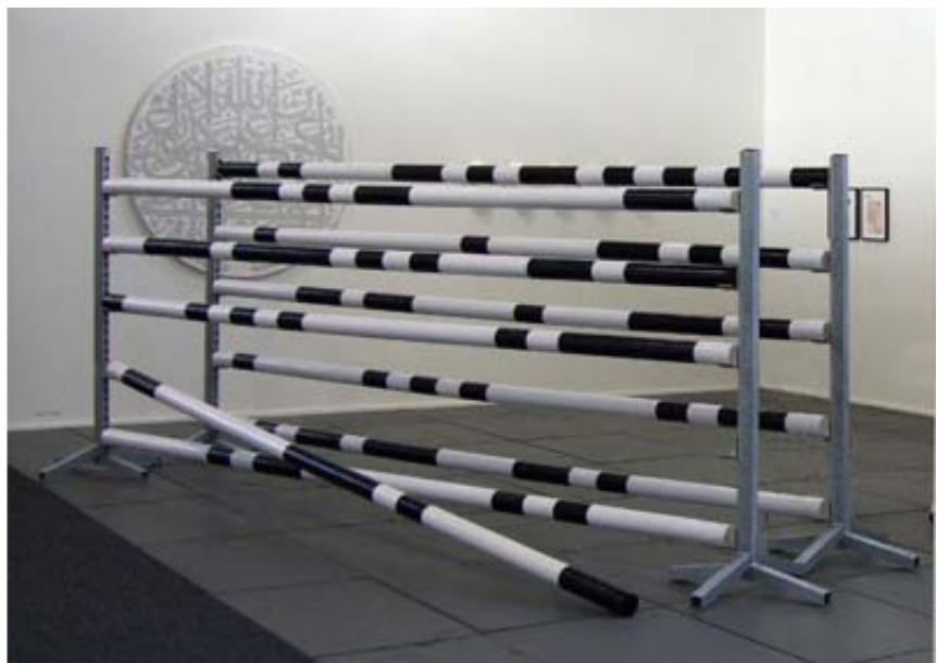
2008, jumping poles, painting, 4 meters wide, size may vary. Exhibition view of Art Brussels, Conrads, 2009, Dusseldorf. Ed. of 1 + 1 A.P.

Les barres de saut d'obstacles, appartenant initialement au monde hippique, sont des signes récurrents, matériel détourné en matériau plastique, du vocabulaire formel de mounir fatmi.