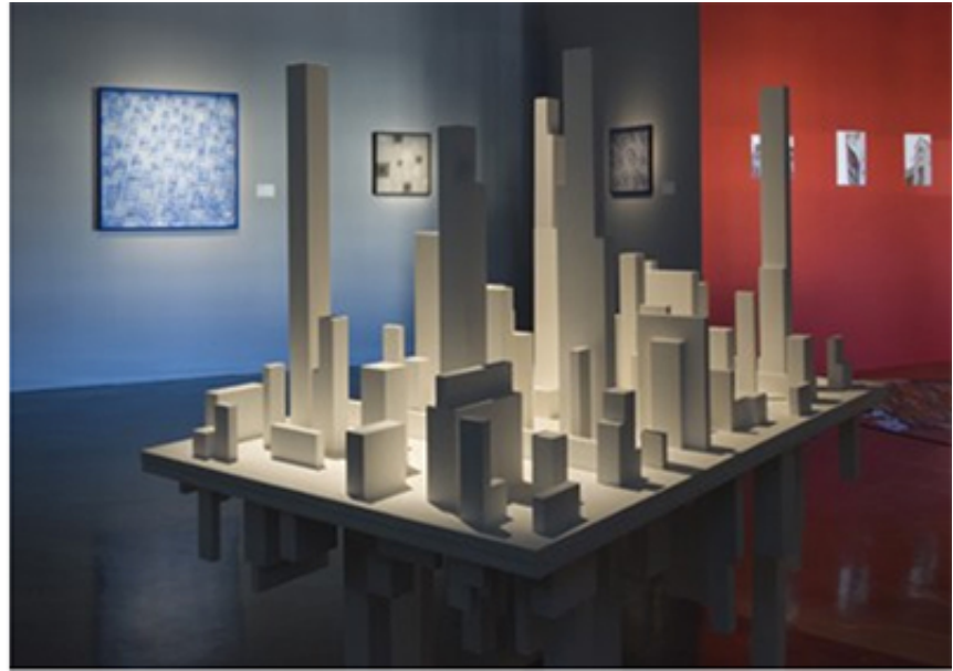
2007, wood table, 160 x 90 x 75 cm. Exhibition view of Le Maroc Contemporain, Institut du Monde Arabe, 2014, Paris. Ed. of 5 + 1 A.P.