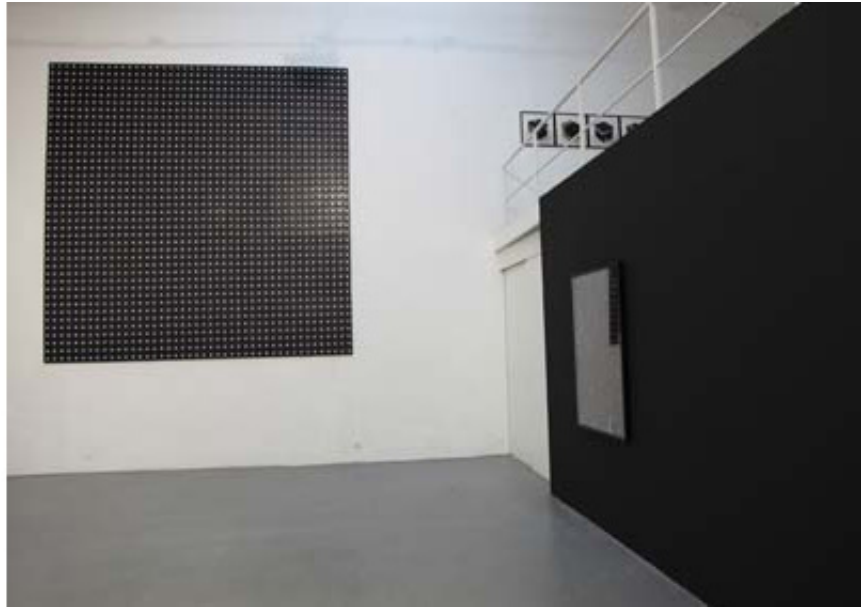
2010, blank VHS, 418 cm high x 413,6 cm wide. Exhibition view of Seeing is believing, Galerie Hussenot, 2010, Paris Ed. of 5 + 1 A.P.

Vaste composition murale, Ecrans noirs se présente comme un tableau de grand format, réalisé à partir de cassettes VHS. Ces cassettes, détournées de leur usage usuel, se voient transformées en éléments décoratifs, dont le motif itératif trouve résonance dans la rigueur des compositions géométriques de l'art concret ou de l'art minimal. Noir profond du plastique ponctué de manière régulière des ronds blancs des pivots de rembobinage des cassettes, ce tableau offre un effet à la Niele Toroni, « degré zéro » de la représentation picturale.