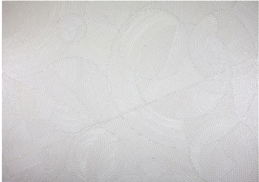
2010-2011, coaxial antenna cables, staples, 207 x 153 x 5 cm. Exhibition view from Suspect Language, Goodman Gallery, 2012, Cape Town. Courtesy of the artist and Ceysson & Bénétière, Paris.