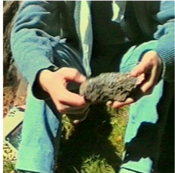
1999-2006, sound compilation.

Cette compilation sonore « Fragments et solitude » réalisée entre 1999 et 2006, regroupe des pièces dont le thème commun est le langage, ses possibilités de communiquer avec l'autre et sa capacité à transformer le monde. Face à l'incommunicabilité, à la séparation, à la censure ou à l'enfermement dans l'identité, cette compilation formule le désir d'une langue capable d'exprimer l'inexprimable en changeant les règles.