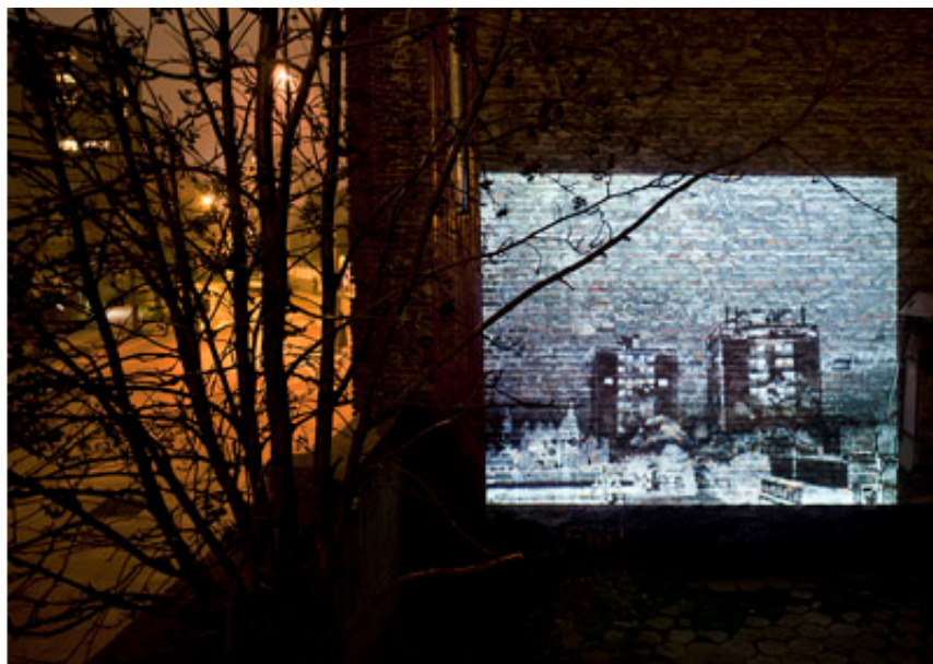
2006-2009, France, 3 min 17, SD, 4/3, B&W, stereo. Size may vary, video projection. Exhibition view from Narracje 4, Gdanska Galeria Miejska, 2012, Gdansk.