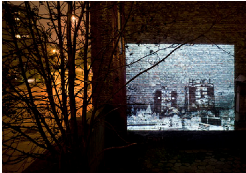
2006-2009, France, 3 min 17, SD, 4/3, B&W, stereo. Size may vary, video projection. Exhibition view from Narracje 4, Gdanska Galeria Miejska, 2012, Gdansk.