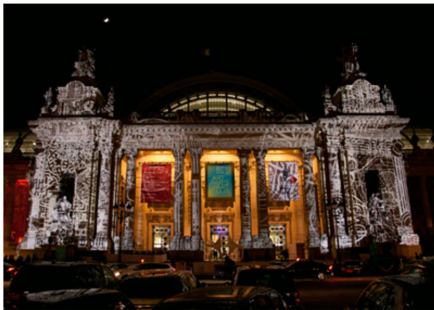
2010-2012, France, video installation, 15 min, HD, B&W, stereo. Size may vary, video projection. Exhibition view from Art Paris, Grand Palais, 2015.

L'installation Les Temps modernes consiste en une projection lumineuse et cinétique qui se déroule en extérieur, sur les édifices architecturaux des villes, ou en intérieur sur les murs des espaces d'exposition artistique. Elle donne à voir une ample et complexe composition géométrique mêlant des cercles en rotation, des lignes s'entrecroisant, des motifs calligraphiques circulaires et des symboles linguistiques : lettres arabes accompagnées de leur transcription phonétique universelle. L'œuvre s'accompagne d'une bande sonore tissée de distorsions acoustiques plus ou moins stridentes.